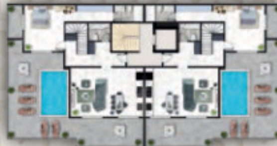
БЛОК В-С ПЛАНИРОВКА (ДУПЛЕКС) Тип-1 / 4+1